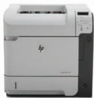
HP LaserJet Enterprise 600 M603dn