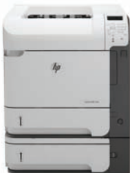
HP LaserJet Enterprise 600 M603xh